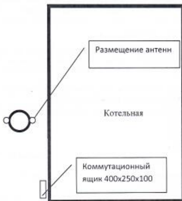
Схема размещения объекта ИП Филоненко А.Н. по адресу пос. Первомайский, ул. Школьная,10

к контракту юридическому лицу / индивидуальному предпринимателю № 8000156 от « 29 » апреля 2022 г.